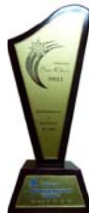
Sao Khuê 2011 Hiệp hội Phần mềm Việt Nam (VINASA)