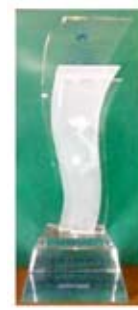
Top 100 doanh nghiệp thương mại dịch vụ tiêu biểu 2010 của Bộ Công Thương