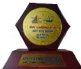
Huy chương vàng sản phẩm phần mềm Việt Nam 2004 về phần mềm Kế Toán EFFECT của Hội Tin Học TP.HCM