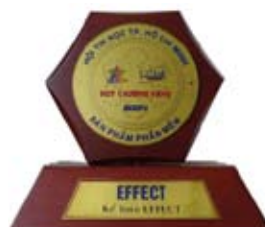
Huy chương vàng ICT VN 2004, 2005 về sản phẩm Kế Toán Quản Trị Doanh Nghiệp của Hội Tin Học TP.HCM