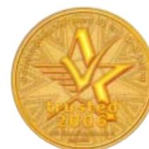
Doanh Nghiệp Việt Nam Uy Tín - Chất Lượng 2006 về Công Nghệ Thông Tin của Bộ Thương Mại